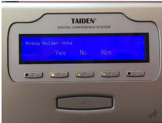
Imagen 4: Dispositivo para hablar/votar mostrando en pantalla SÍ/NO/ABSTENCIÓN: