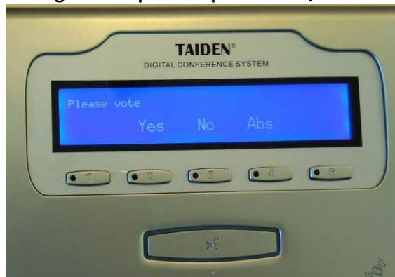
Imagen 3: Dispositivo para hablar/votar – votación