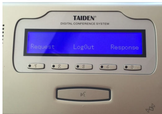
Imagen 2: Dispositivo para hablar/votar – pantalla estándar

Request (Solicitar): Pulsando la tecla 1 puede solicitar el uso de la palabra. Este debe ser el botón principal.