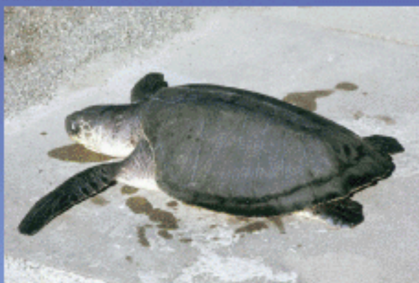
Lepidochelys olivacea (Olive Ridley; Đồi mồi dứa)