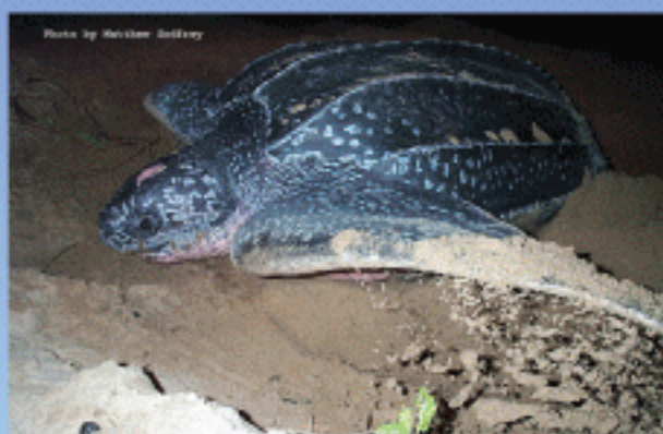
Dermochelys coriacea (Leatherback; Rùa da)