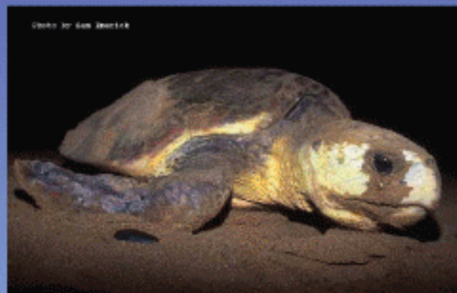
Caretta caretta (Loggerhead; Quán đồng)