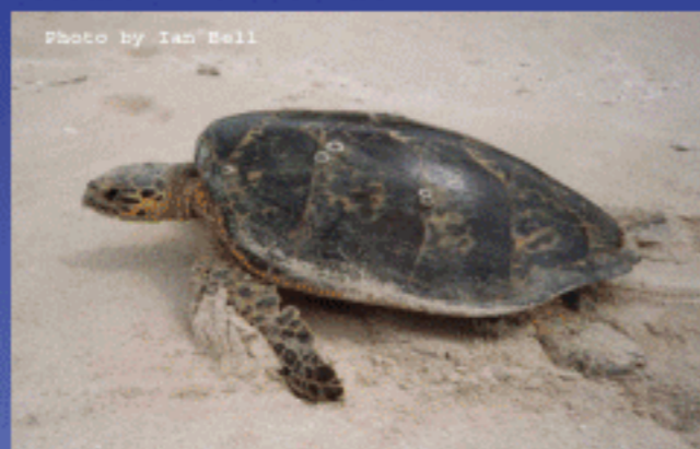
Eretmochelys imbricata (Hawksbill; Đồi mồi)