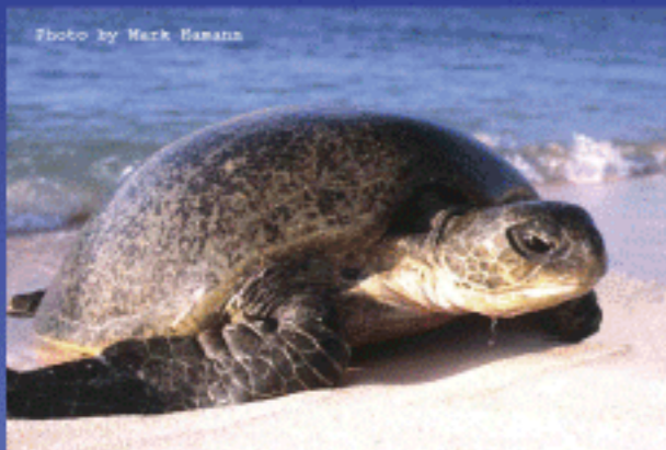
Chelonia mydas (Green; Vích)